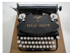
Klein Adler 1913