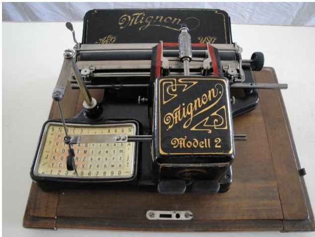
MIGNON 2 Deutschland 1904 Zeiger-Schreibmaschine mit Typenzylinder