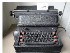
Electromatic (IBM) 1930