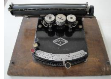
Gundka 5 1924