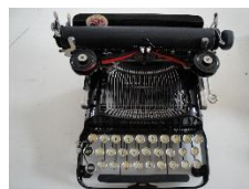
Corona 3 1912