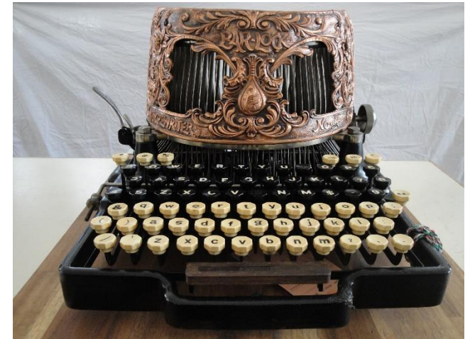
BAR-LOCK 6 Volltastaturmaschine mit Oberaufschlag 1896

Im alten Schulhaus Dorfstrasse 22 8242 Bibern