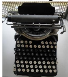
Yost 4 1894

Adler Kanzler AEG Mignon Mercedes Alpina M-Office Bambino Monarch Barr-Lock National Bing Oliver Blick (Adler) Olivetti Blickensderfer Olympia Blista Optima Brillant Confort Orga Privat Brother Patria Calanda Picht Carmen Princess Caligraph Racer Collegiate Recta Consul (Zeta) Remington Continental Rheinmetall Corona Royal Diamant Salter Erika Senta Everest Siemag Express Silver-Reed Facit Smith Franklin The Fox Grandjean Tip-Tip Gritzner Torpedo Groma Toshiba Gundka Triumph Halda Underwood Hammond Urania Hermes Victor IBM Williams Ideal Woodstock Imperial Yost Japy