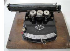
Gundka 5 1924