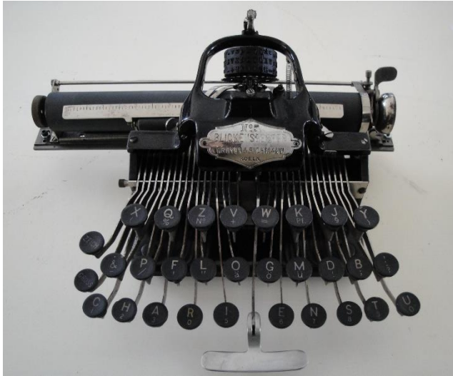
BLICKENSDERFER 5(b) USA 1895/1896 Typenzylinder mit Oberaufschlag

Erste Patente für primitive Schreibmaschinen wurden bereits im 18. Jahrhundert erteilt. Als eigentlicher Erfinder wird von Experten Henry Mill aus England erwähnt, der 1714 sein 1. Patent, Nr. 395, erhielt. Im 19. Jahrhundert brach eine wahre Euphorie aus. Dutzende Hersteller weltweit versuchten mit eigenen Erfindungen ihr Glück.