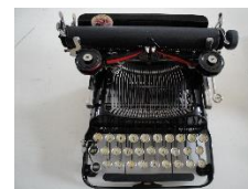
Corona 3 1912