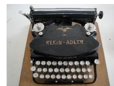
Klein Adler 1913