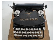
Klein Adler 1913