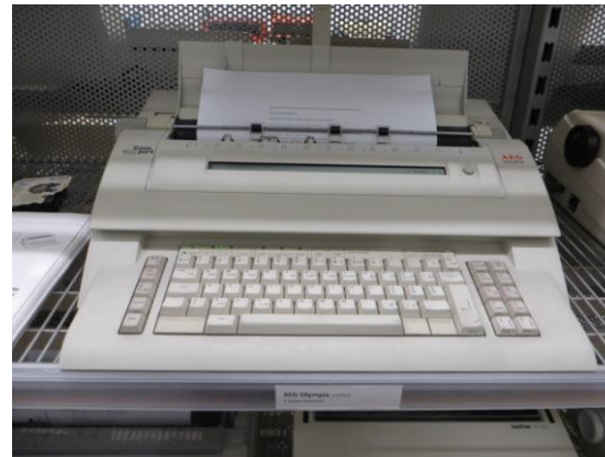
Canon Typenrad Schreibmaschine 80er J.