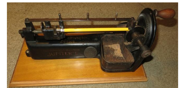
Die Guhl Jupiter, Bleistiftschärfmaschine