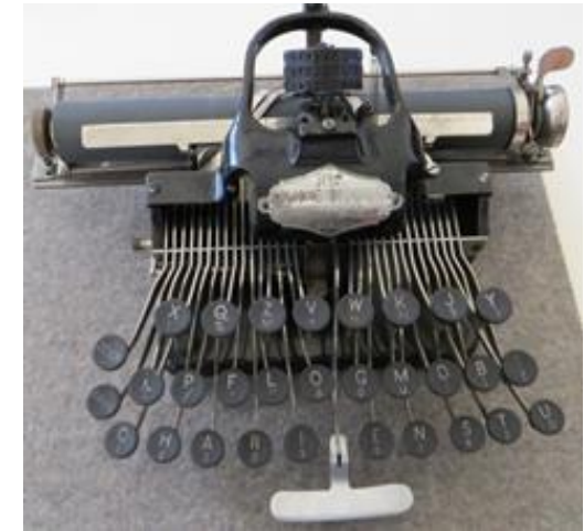
Die Blickensderfer Nr.5 mit Zylinder-Schreibkopf.