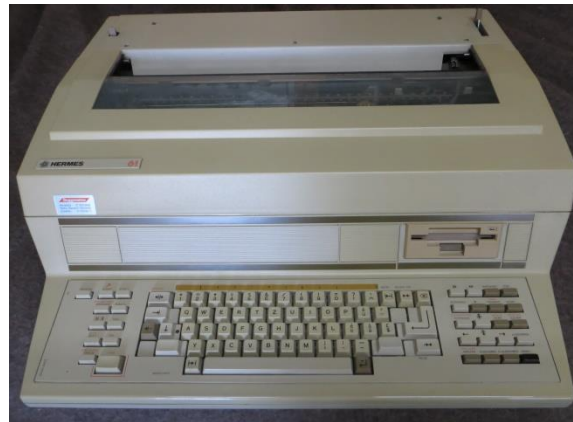
Hermes 61 Typenrad-Schreibmaschine