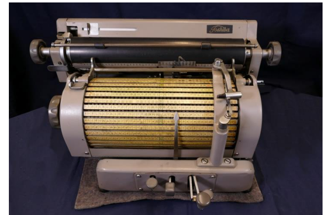
Die Schreibmaschine mit japanischen Schriftzeichen von Toshiba