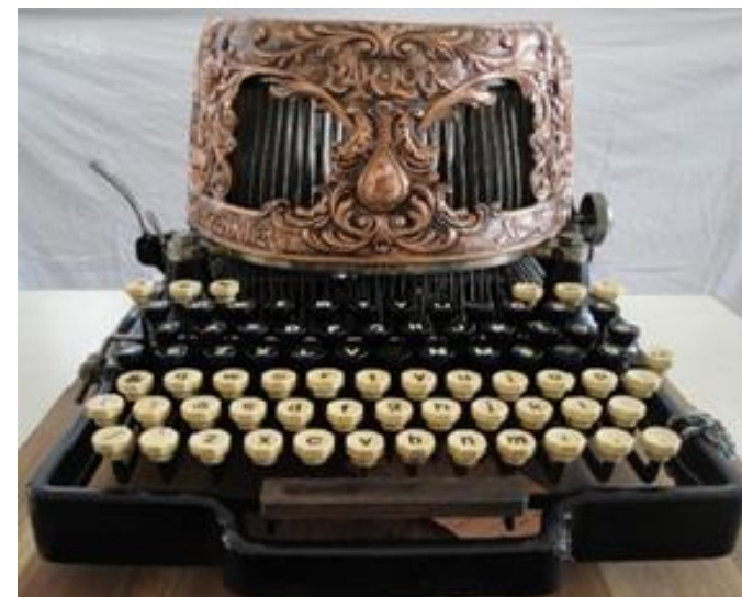
Barlock 6 Volltastaturmaschine mit Oberaufschlag ab 1896

Im alten Schulhaus Dorfstrasse 22 8242 Bibern