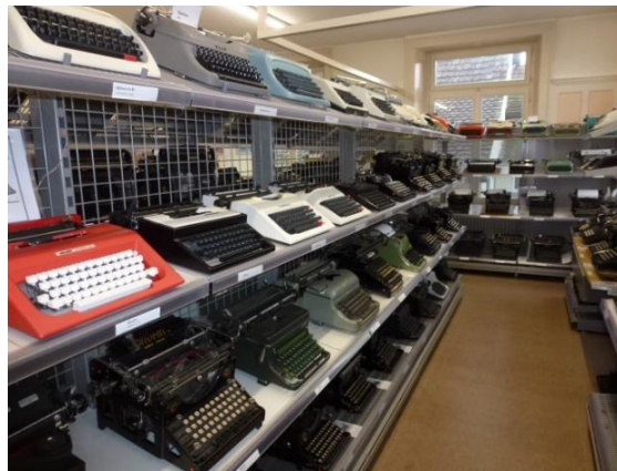
Blick in die Gestelle

Man wählt das Zeichen, die Metalltype wird über das Hebelsystem über die Farbrolle auf das Blatt gebracht. Die Zeichensätze können für die Sprachregionen gewechselt werden.