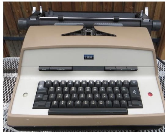
Die elektrische IBM Modell D. Spezialanfertigung als Blindenschreibmaschine mit Braille Schrift.