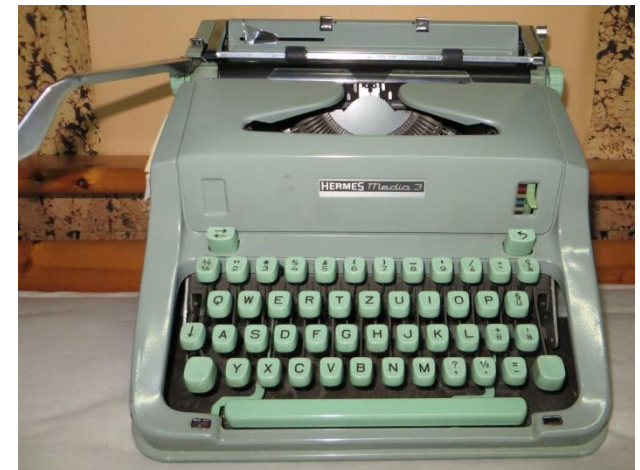
Die Hermes Media 3 der 60er Jahre Die gute Schweizer Maschine für das Heimbüro .