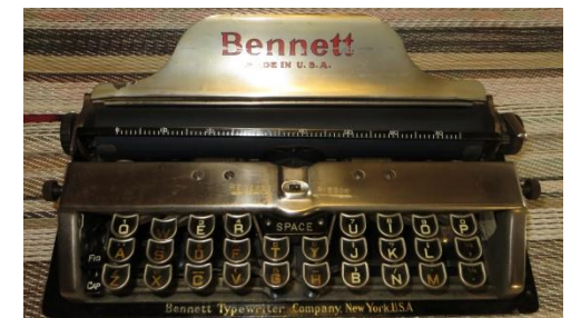
unsere kleinste mechanische Schreibmaschine