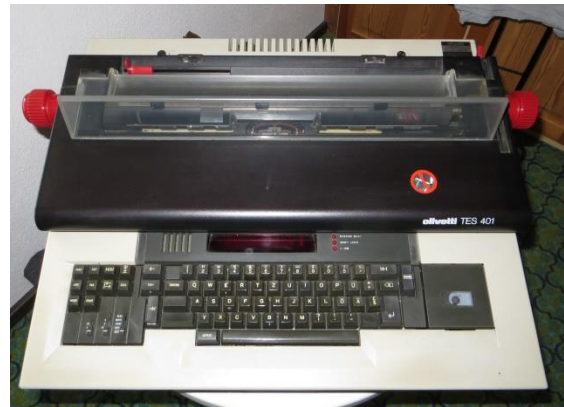
Olivetti TES 401, Typenrad,-mit mini Diskette.