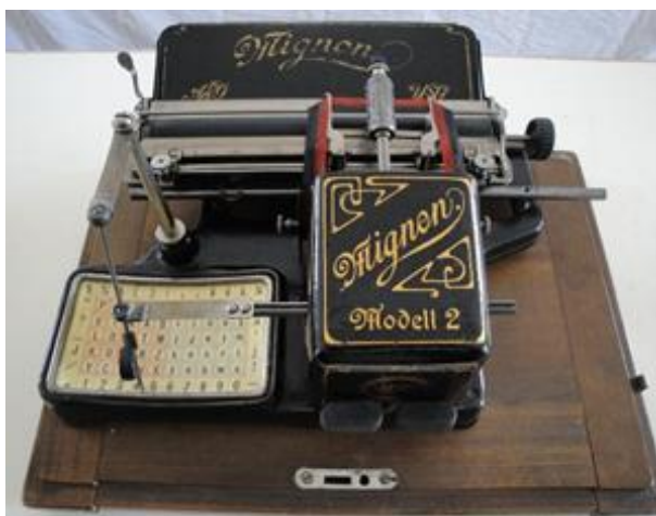
Die Mignon Modell 2 ab 1900

Drei-Sammler hatten viele Schreibmaschinen und die Idee, ein Schreibmaschinen-Museum zu gründen. Mit dem Vorschlag klopften sie beim Präsidenten des Reiat Tourismus Thayngen an. Dank der Gemeinde Thayngen und deren «zur Verfügungsstellung von Räumen im alten Schulhaus Bibern», konnte 2017 unter dem Patronat vom Verein Reiat Tourismus , dieses Museum eröffnet werden. 2023 wird nun die Trägerschaft für das SSM Bibern durch den www.kulturverein-thayngen.ch abgelöst. Kuratoren und Helfer arbeiten im Frondienst